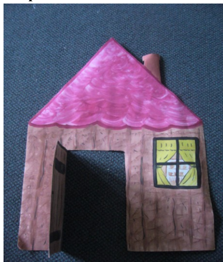
A kismalac háza