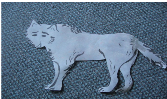
A mesében szereplő farkas