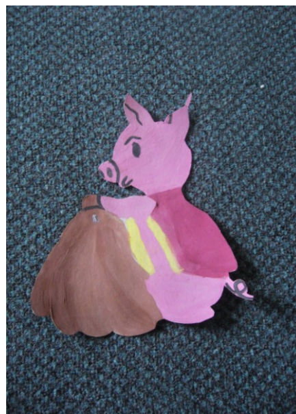
A mesében szereplő kismalac