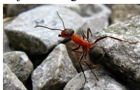
Bárhol képesek megélni

Külsőalakját tekintve okosabbnak kéne lennie, mint amilyen – és ezt most nem bántásból jelentettem ki, hanem mert a feje közel akkora (majdnem hogy nagyobb) a potrohánál, amely hasonlatot emberre kivetítve úgy vélem megoldódna az összes problémánk a túléléssel kapcsolatban. Pikantériája a kedves apró lényeknek, hogy a szemük a fejük oldalán helyezkedik el, ezért igazolhatóan ők is másképp látják a világot!