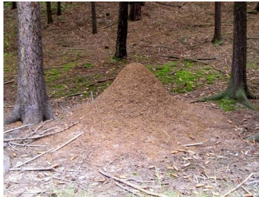
Ilyen méretű hangyabolyt senki se próbáljon széttaposni...

Hogy meddig élnek ezek a teremtmények, senki sem tudja – valószínű eltaposásuk, vegyszerrel való lefújásuk, avagy nagyítóval történő megsütésük pillanatáig.